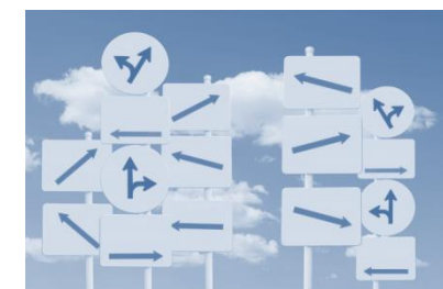
多様化する働き方の選択

企業活動を継続するために、 多様な選択肢 に 対応した仕組みを整備する時代に入りました