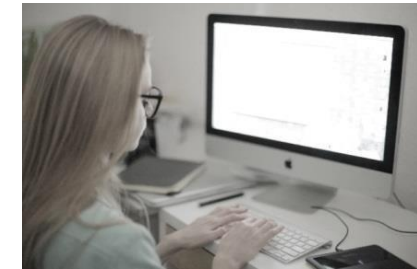
BCPにも対応できる ワークスペース